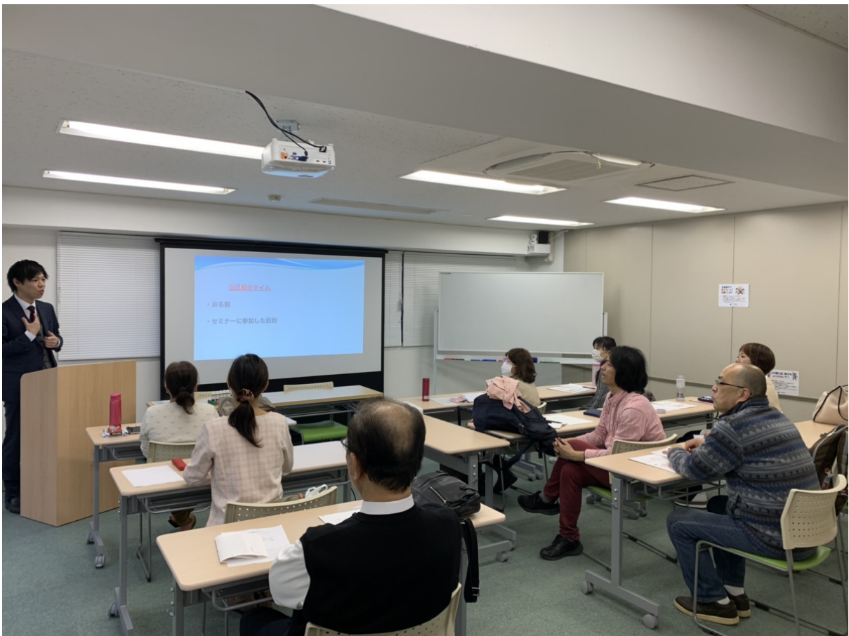
※実際のセミナー風景です※