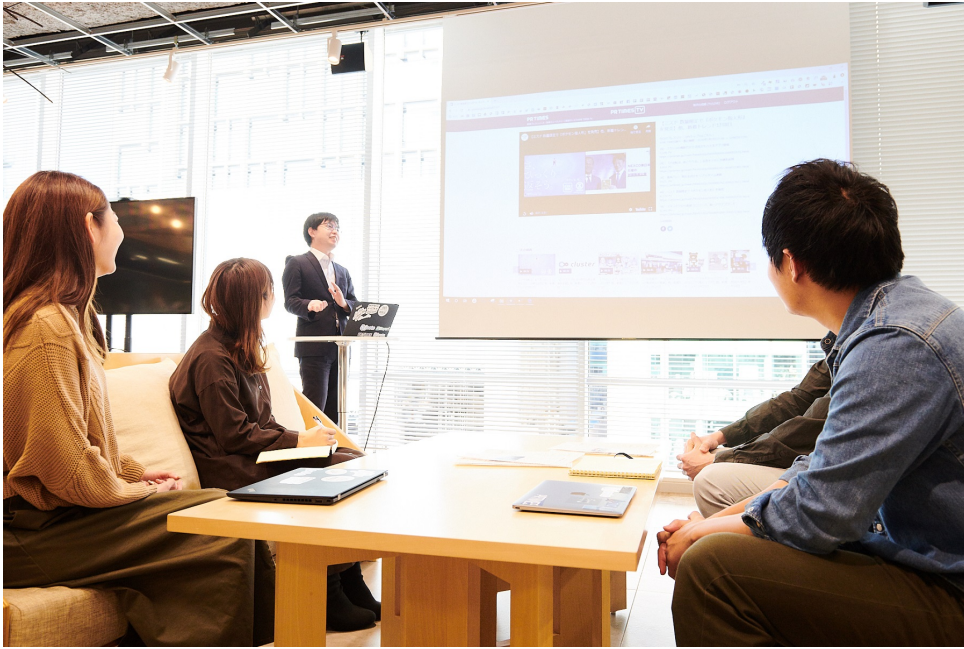
※実際のセミナー風景です※